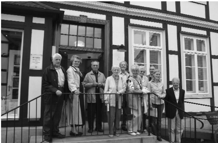
Der Besuch der „Alten Apotheke“

30 Heimatfreunde (20 Bad Polziner und 10 Belgarder aus Stadt und Land) nahmen teil am Treffen der Bad Polziner